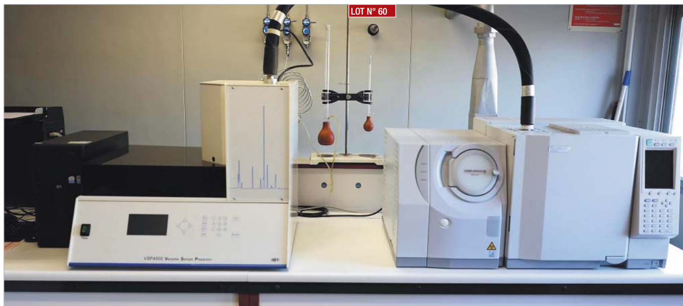
► Spectromètre de masse phase gazeuse SHIMADZU, mod. GCMS-QP2010SE et préparateur d'échantillons IMT, mod. VSP 4000 (2011) ► SHIMADZU gas mass spectrometer, model GCMS-QP2010SE, No. 02053487007 with control station and IMT sample preparer, model VSP 4000 (2011)

Ce dépliant photos ne présente qu'un échantillon des matériels proposés à la vente.