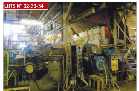
LOTS N° 32-33-34