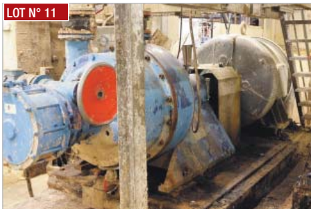
LOT N° 11