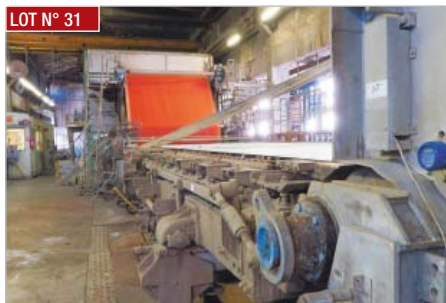
LOT N° 31