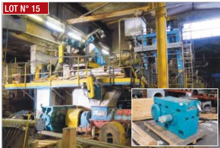
LOT N° 15