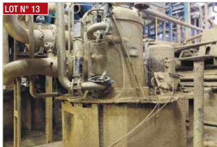
LOT N° 13