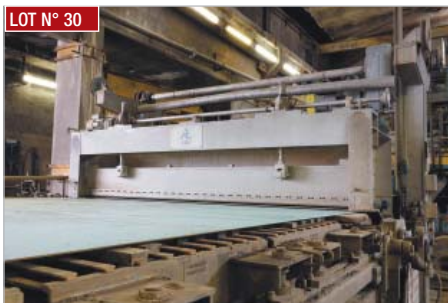
LOT N° 30

Laize 3300 mm, speed 850 m/mn 6 T/h, 150 T/day, grammage 30 to 100 g/m 2