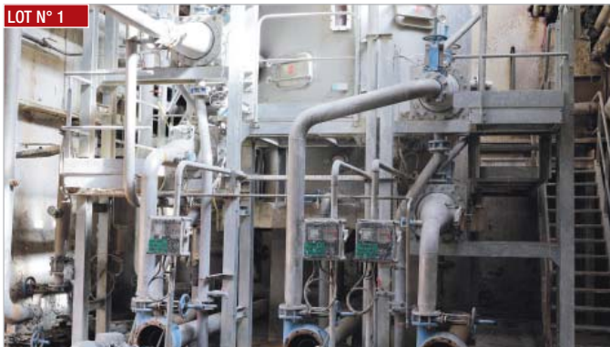
LOT N° 1