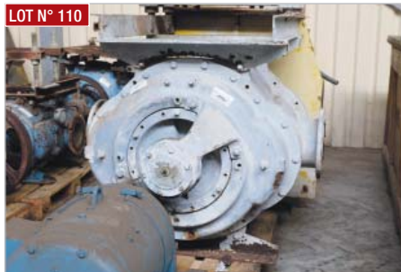
LOT N° 110