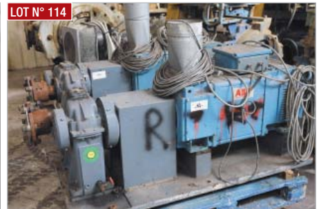
LOT N° 114