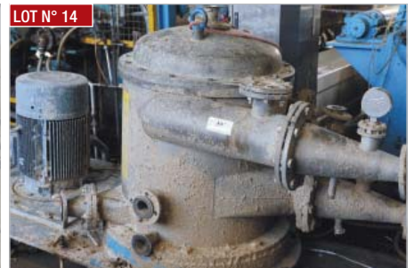
LOT N° 14