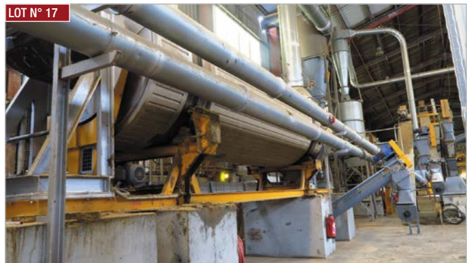
► Trommel VENTIL ► VENTIL trommel