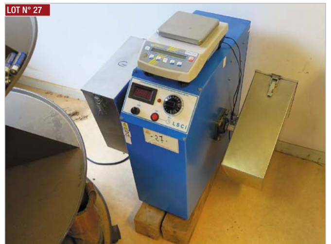
▶ Durabilimètre LSCI ▶ LSCI hardness meter with accessories