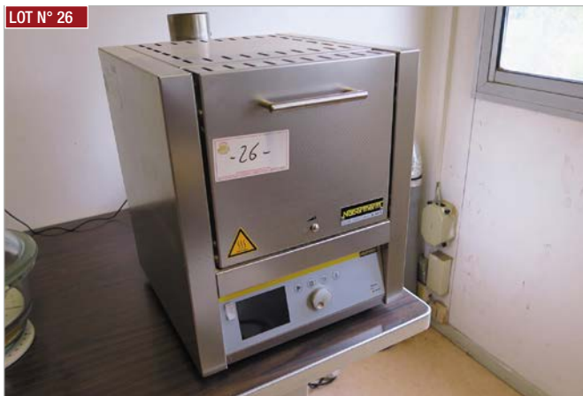
▶ Etuve NABERTHERM , mod. L5/11/B410 (2016), température 1100°, puissance 2,4 Kw ▶ NABERTHERM oven, mod. L5/11/B410 (2016), temperature 1100°, power 2.4 kW