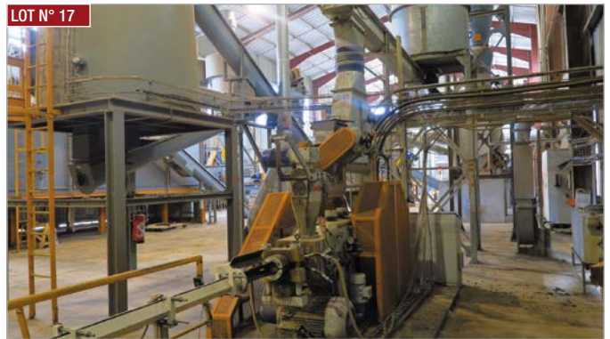
► Presse à brique PIPIU, mod. BRIK MB 80 ► PIPIU briquette press, mod. BRIK MB 80