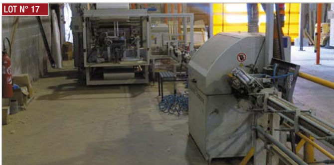
► Scie MOST, type MBC 100 (2011), contrôle de longueur et filmeuse et tunnel de rétractation ► MOST saw, type MBC 100 (2011), Length control, Wrapper and shrink tunnel