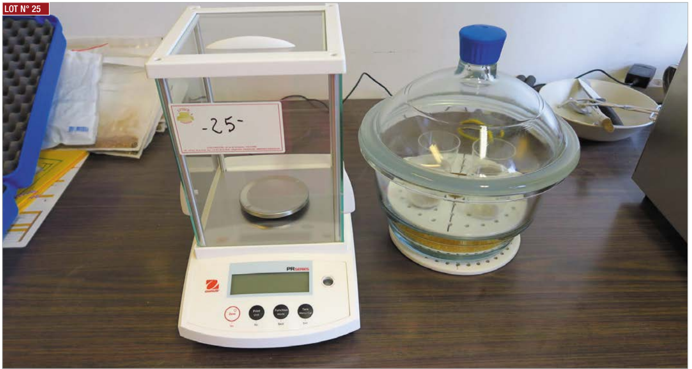
▶ Balance de précision OHAUS , mod. PR124E ▶ OHAUS precision balance, mod. PR124E