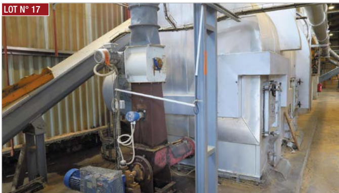
► Foyer MAGUIN PROMILL 1,7 MW ► MAGUIN PROMILL 1,7 MW firebox