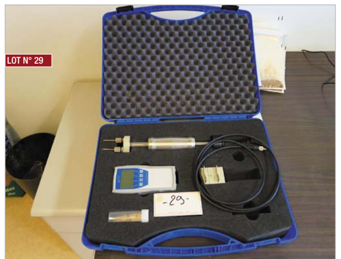
▶ Testeur d'humidité HUMITEST ▶ Humidity tester, HUMITEST