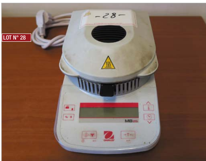
▶ Dessiccateur OHAUS , mod. MB25, maxi 110 gr ▶ OHAUS dryer, mod. MB25, max 110 gr