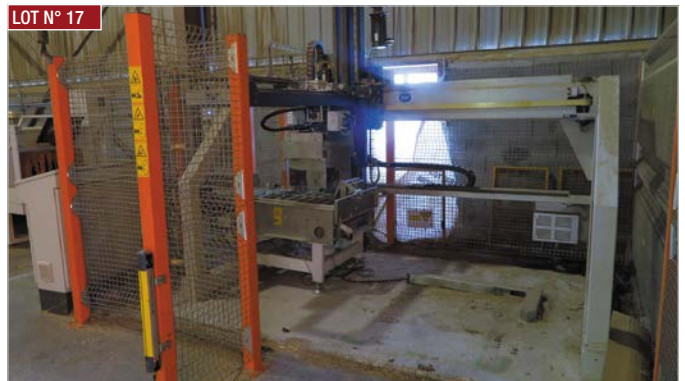
► Palettiseur MF TECNO ► MF TECNO palletizer