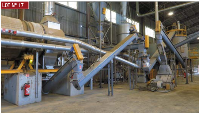
► By-Pass, vis de transfert, buffer 7 m 3 produit sec, épierreur, affineur, transport pneumatique, ventilateur du TP, trémie de presse et divers équipements ► By-Pass, Screw, Buffer 7 m 3 dry product, Stoner, Refiner, Pneumatic transport, TP fan, press hopper and various equipment